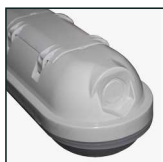
możliwość łączenia opraw