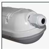
dławnica zapewniająca hermetyczność