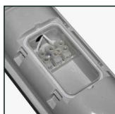
kostka montażowa ze zdjętą osłoną