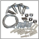
U-CORD1 - Zestaw montażowy linka 100cm