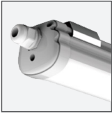
Dławnica zapewniająca szczelność