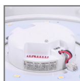
zasilacz z funkcją półcienia - 30% mocy (modele MD)