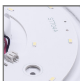
wbudowane źródła światła LED