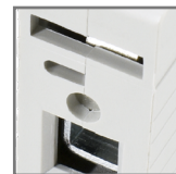
możliwość połączenia za pomocą szyn grzebieniowych