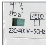
kontrolka sygnalizująca zadziałanie