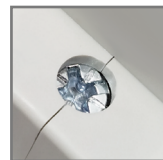
zaciski ze stali ocynkowanej