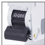
możliwość plombowa- wania