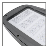
diody LED PHILIPS z soczewkami