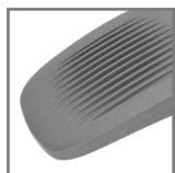
radiator odprowadzający ciepło