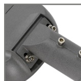
możliwość regulacji kąta pochylenia