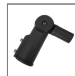
adaptery dostępne na stronie 61