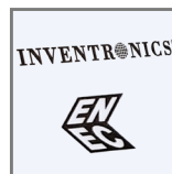
niezawodny zasilacz INVETRONICS