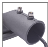
montaż na słupach Ø50 i Ø60