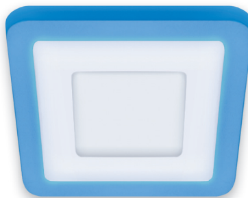
② ALINA LED D 3W+3W 4000K