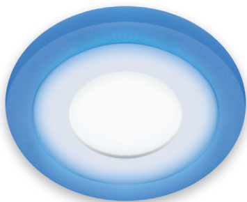
① ALINA LED C 3W+3W 4000K