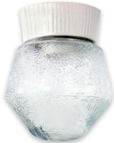
① BALL LAMP GLASS