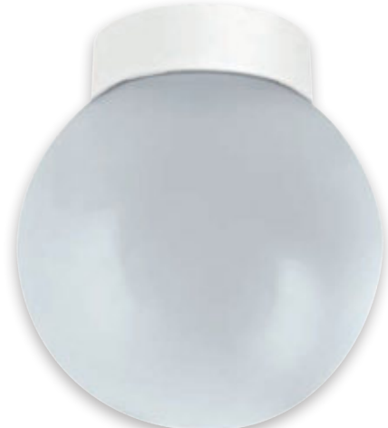
② BALL LAMP PLASTIC