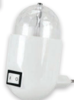
⑥ IMPRA LED 3,5W