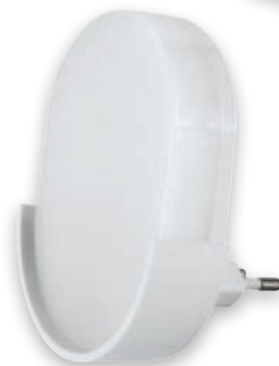
⑤ BEZA LED 1W L