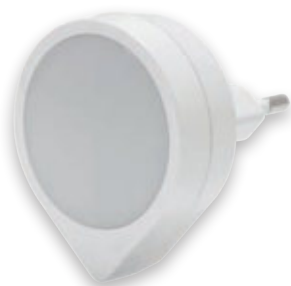
② ELA LED 0,4W