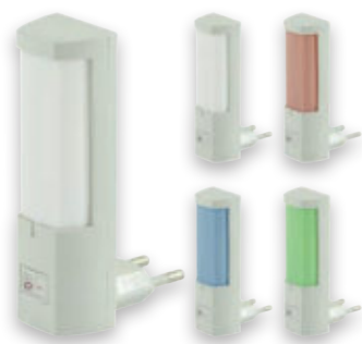
① DORA HL990L WIEZA