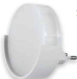
④ BEZA LED 1W C