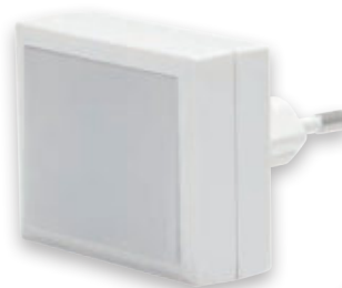
③ OLO LED 0,4W