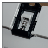
mocowanie na szynę TH35