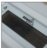
wyświetlacz LCD: 6+1 cyfr (BM03B-L), 6+2 cyfr (BM030-L)