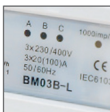
kontrolki (A, B, C) stopnia obciążenia faz oraz kontrolka wyjścia impulsowego