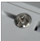
zaciski/sruby ze stali ocynkowanej

ENERGY INDICATOR 3-PHASE STROMMESSGERÄT 3-PHASEN СЧЕТЧИК ЭЛЕКТРИЧЕСКОЙ ЭНЕРГИИ 3-ФАЗОВЫЙ INDIKÁTOR SPOTŘEBY ENERGII TŘÍFÁZOVÝ