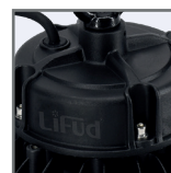
zewnętrzny zasilacz LIFUD*