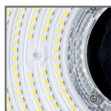
wymienne soczewki 120° / 90°