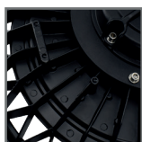
radiator odprowadzający ciepło