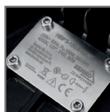
grawerowana tabliczka znamionowa