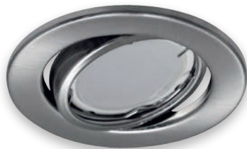
② KAJKA C MATCHR