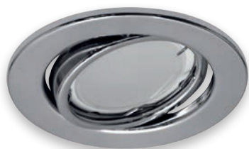
① KAJKA C CHROME