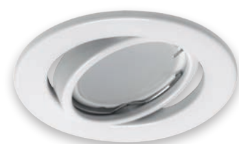
③ KAJKA C WHITE