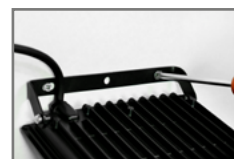
prosty montaż oprawy bez konieczności odkręcania uchwytu