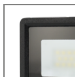
szkło z powłoką „frosted glass”