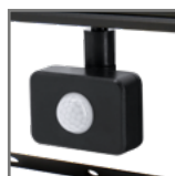
zintegrowany czujnik ruchu PIR