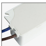
hermetycznie zamknięta obudowa