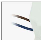
przewody wejściowe ~230V

POWER LED SUPPLY 12V DC IP67 ELEKTRONISCHER NETZTEIL LED 12V DC IP67 ИСТОЧНИК ПИТАНИЯ LED 12V DC IP67 NAPÁJECÍ TRANSFORMÁTORY PRO LED 12V DC IP67