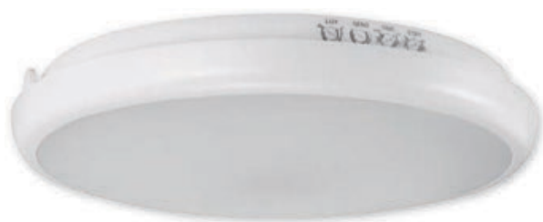
① EDYTOR LED C MVS 15W NW