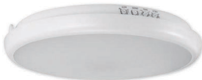
② EDYTOR LED C MVS 21W NW