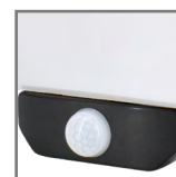
zintegrowany czujnik na podczerwień