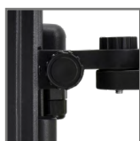
beznarzędziowa regulacja i podłączenie elektryczne