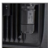
hermetyczna dławnica IP68