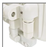
dwie wersje kolorystyczne obudowy