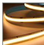
mocne, równomierne światło 384 led/m