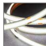
3 barwy światła