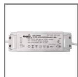
zasilacz w komplecie