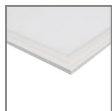
panel w kolorze białym