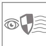
brak efektu migotania