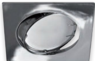
④ OKTAN D CHROME