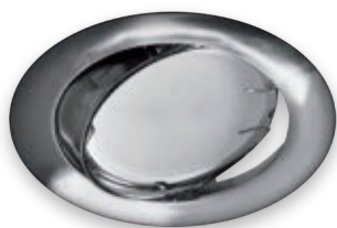
① OKTAN C CHROME