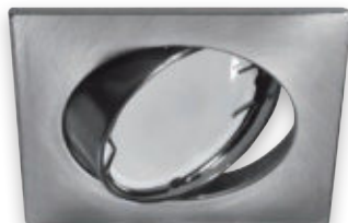
⑤ OKTAN D MATCHR