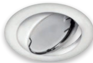
③ OKTAN C WHITE