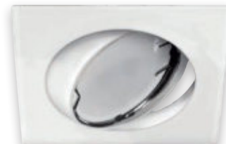
⑥ OKTAN D WHITE