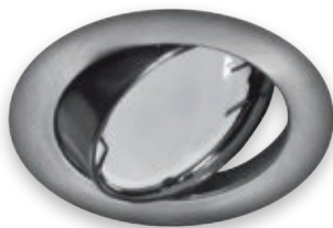
② OKTAN C MATCHR