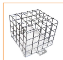
opcjonalna kratka ochronna