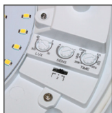
PSF705 - czujnik ruchu