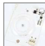
PLB-215 wnętrze oprawy