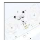
PLB-270 wnętrze oprawy