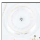
źródła LED z układem optycznym