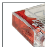
kolorystyka ułatwiająca identyfikację modelu