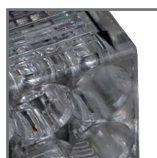
obudowa wykonana z wysokiej jakości poliwęglanu