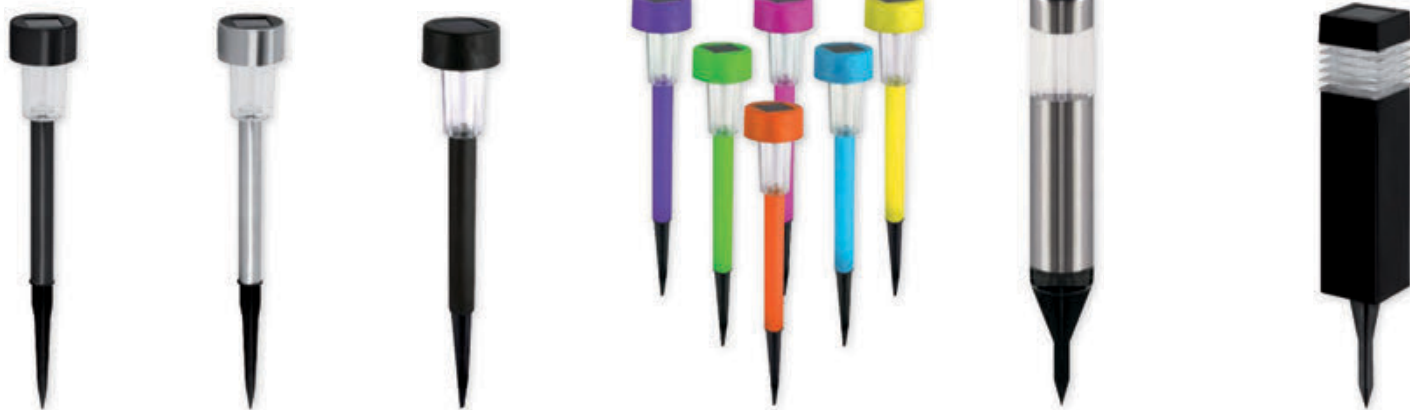
① PROSTO LED 30 0,06W BLACK CW ② PROSTO LED 30 0,06W CHROME CW ③ SOPLA LED 36 0,06W BLACK CW ④ SOPLA LED 36 0,06W COLOR CW ⑤ HEL LED 32 0,06W CW ⑥ ZEN LED 39 0,06W BLACK CW