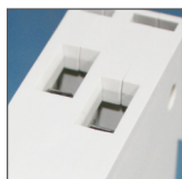
pojemność zacisków 6mm 2

RESIDUAL CURRENT CIRCUIT BREAKER WITH OVERCURRENT PROTECTION FI/LS-KOMBISCHALTER МОДУЛЬНЫЕ КОНТАКТОРЫ PROUDOVÝ CHRÁNIČ S JISTIČEM