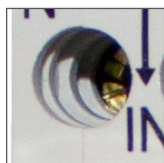
zaciski/śruby ze stali ocynkowanej