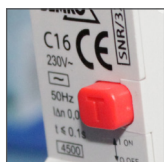
przycisk kontrolny TEST