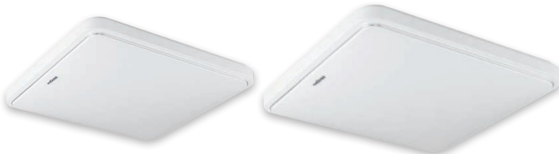
① SOLA LED D SLIM MVS 20W 4000K