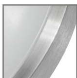
mleczny klosz ze srebrną aluminiumową ramką