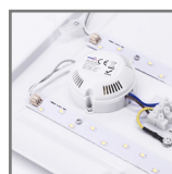
LHS wnętrze oprawy