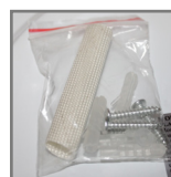
zestaw montażowy w komplecie