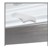
LHS-310 zaczep klosza