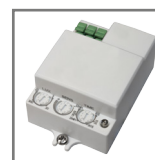
możliwość instalacji mikrofalowego czujnika ruchu