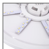
LHR wnętrze oprawy