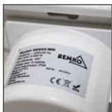
montaż w puszcze instalacyjnej Ø60