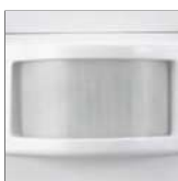
soczewka PIR (SES02WH, SES03WH)