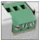
podłączenie 3-przewodowe (L, N, L 2 )

MOTION SENSOR BEWEGUNGSMELDER ДАТЧИКИ ДВИЖЕНИЯ POHYBOVÉ ČIDLO