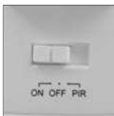
włącznik czujnika lub załączenie stałe